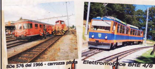
BDe 576 del 1966 - carrozza pilota Elettromotrice BHE 4/8

Prezzi andata e ritorno - Bimbi < 6 anni gratis Malnate ----- €35 -----ridotti €17.50 Valmorea ----- €27 -----ridotti €13.50