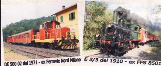
DE 500 02 del 1971 - ex Ferrovie Nord Milano E 3/3 del 1910 - ex FFS 8501

INFORMAZIONI : IL TRENO DELLA MATTINA DELLE ORE 8.55 IN PARTENZA DA MALNATE OLONA E RODOERO/VALMOREA VERRA' EFFETTUATO A TRAZIONE DIESEL